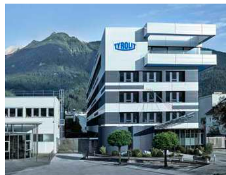
Sede dell'azienda Tyrolit a Schwaz (Austria)

Con sede centrale a Schwaz in Austria, questa azienda a conduzione familiare combina la forza derivante dall'essere parte del dinamico Gruppo Swarovski con un secolo di esperienza aziendale e tecnologica individuale.