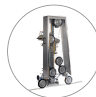
Segatura a filo