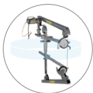
Segatura a filo circolare