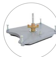
Piastra di fissaggio a vuoto opzionale

DRA150** è particolarmente idoneo per lavori elettrici e di installazione. Questo Supporto di carotaggio è adatto a corone da 500 mm di lunghezza e a fo-