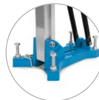
Piede a tassello compatto